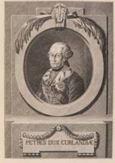
Петръ Борсаръ, герцога Курляндскій. Из собрания Императорской Библиотеки Императора Александра.