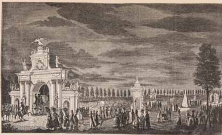
Назначение на дорожку между Петербургомъ и Царскимъ-Селомъ изъ случая прибытия вступившаго вступилъ Гессера.