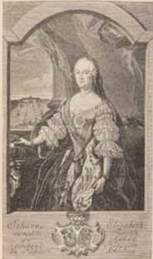
Екатерина Вторая Павловна, Австрийско-Прусская импер. Императрица. III Из собрания Императорской Библиотеки Императора Александра.