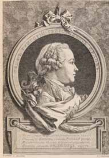
Графиня Григорья Григорьевна Орлова. Из собрания Императорской Библиотеки Императора Александра.