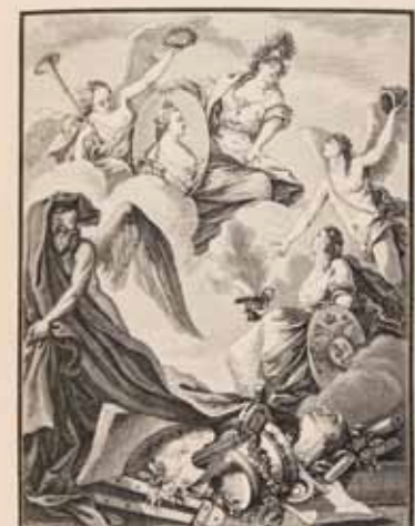
Аллегорія, изображающая коронацію Екатерины II. Из собрания Императорской Библиотеки Императора Александра.