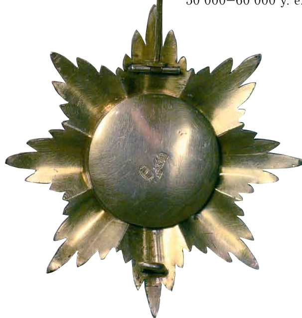
247 Звезда ордена Святого Александра Невского Москва. Частная мастерская. 1877 г. Размер 83 x 79 мм. Вес 60,4 г. Серебро, эмаль

Клейма: на оборотной стороне звезды – 84-й пробы с гербом Москвы, годовое клеймо «1877», именовое клеймо «А.М.».