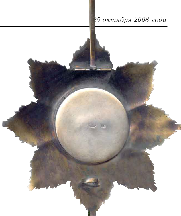
246 Звезда ордена Святого апостола Андрея Первозванного Санкт-Петербург. Частная мастерская. 1870-е гг. Размер 85 x 85 мм. Вес 64,8 г. Серебро, эмаль, позолота

Клейма: на оборотной стороне звезды – 84-й пробы в прямоугольном щитке, герб Санкт-Петербурга, именовое клеймо «WN»; на заклочке – герб Санкт-Петербурга, именовое клеймо «WN».