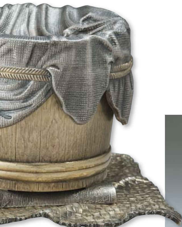
76 Солонка в русском стиле Россия, Москва, 1861 г. Мастер – монограммист «ПМ» Серебро, чеканка, гравировка, позолота, монтировка

Клейма: 84-й пробы, герба города, пробирного мастера – «ВС» над датой «1861», мастерской – «ПМ». Высота 7,5 см. Вес 460,5 г