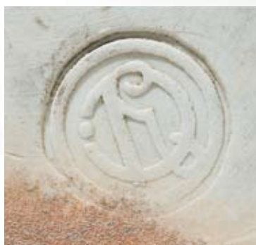
122 Вазы для цветов парные Россия, Москва, начало XX в. Императорское Строгановское училище Фарфор, цветная глазурь «бычья кровь»