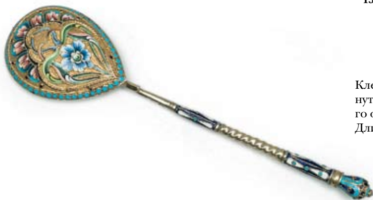
130 Ложка десертная Россия, Москва, 1908–1917 гг. Мастерская серебряных изделий Николая Зверева Серебро, перегородчатая эмаль, расписная эмаль

Клейма: 84-й пробы с женской головкой в кокошнике, повернутой вправо, в щитке в виде лопатки и шифром пробирного округа, мастерской – «НЗ».