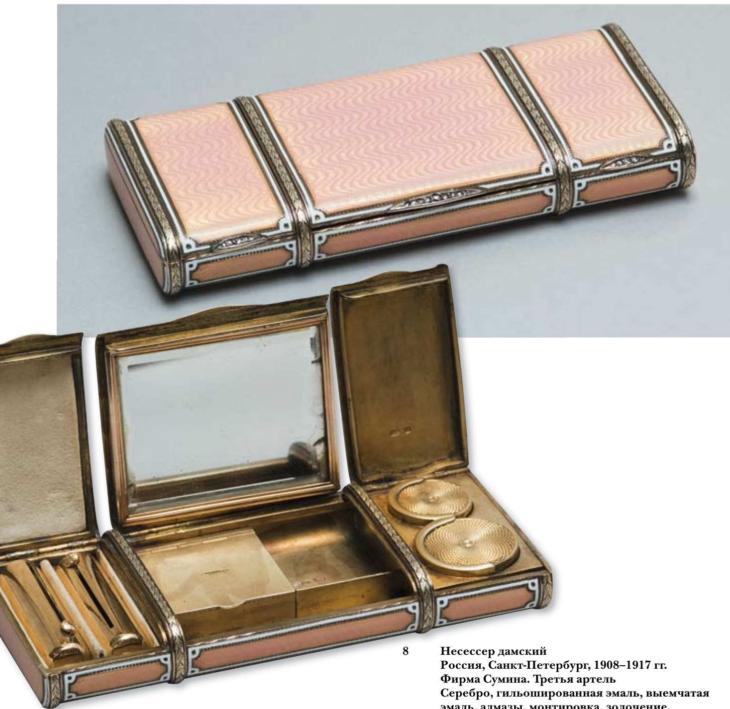
8 Несессер дамский Россия, Санкт-Петербург, 1908–1917 гг. Фирма Сумина. Третья артель Серебро, гильшированная эмаль, выемчатая эмаль, алмазы, монтировка, золочение, гравировка

Клейма: 88-й пробы с женской головкой в кокошнике, повернутой вправо, и шифром пробирного округа, фирмы – «СУМИНЪ», мастерской – «3-я А». Размер 11,5 x 5 x 1,5 см. Вес 277,4 г