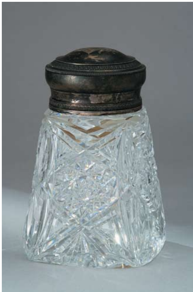
125 Чайница в классическом стиле Россия, Санкт-Петербург, 1908–1917 гг. Мастер – монограммист «МС» Хрусталь, серебро, литье, монтировка

Клейма: 84-й пробы с женской головкой в кокошнике, повернутой вправо, в круглом щитке, мастерской – «М.С». Сверху на крышке гравированный вензель. Высота 15 см. Общий вес 1 064,6 г