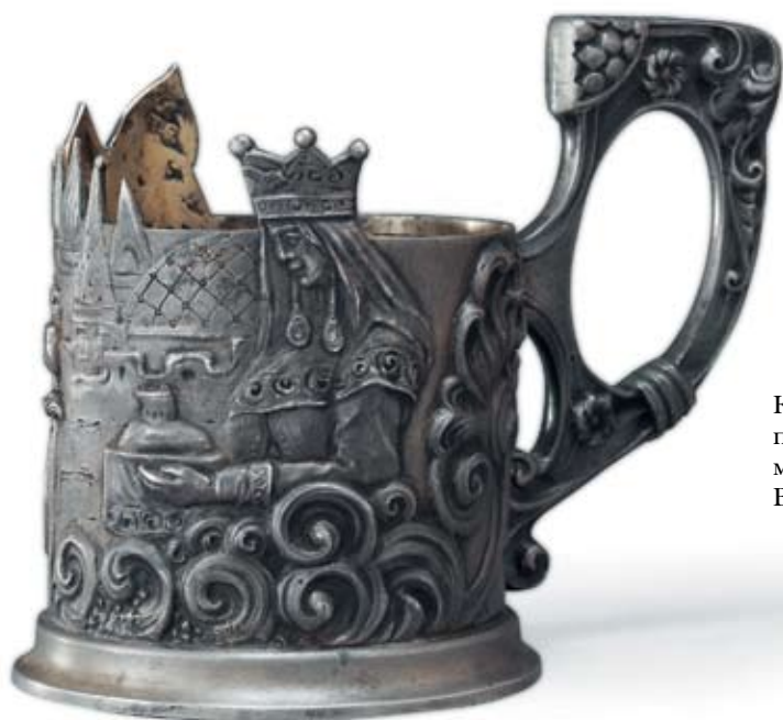
34 Подстаканник «Царевна и богатыри» Россия, Санкт-Петербург, 1908–1917 гг. Мастерская А. Брагина Серебро, литье

Клейма: 84-й пробы с женской головкой в кокошнике, повернутой вправо, и шифром пробирного округа, мастерской – «АБ». Гравированный вензель «ВО». Высота 10 см. Вес 281,3 г