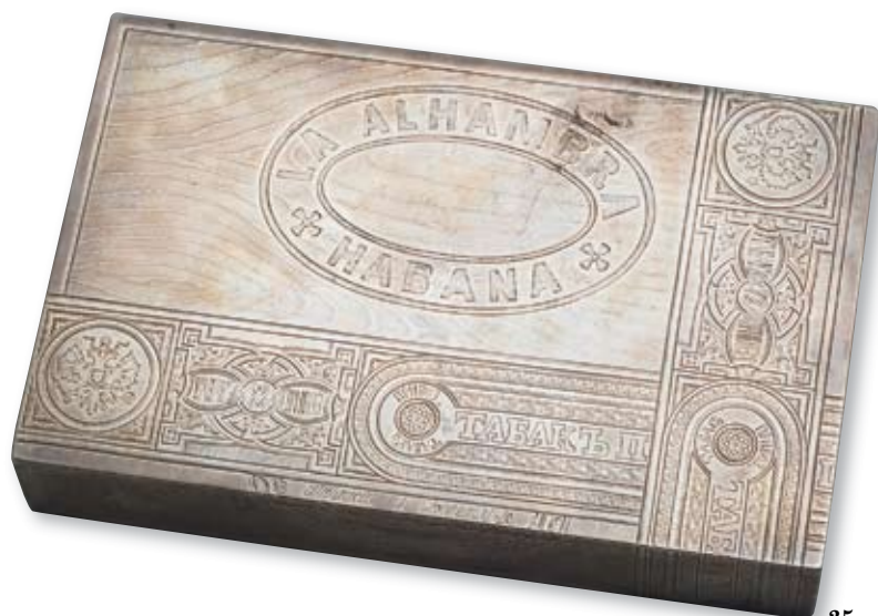
35 Коробка сигарная Россия, Москва, 1889 г. Фабрика золотых, серебряных и бронзовых изделий Андрея Постникова Мастер – монограммист «И.Ш.» Серебро, гравировка, монтировка

Клейма: 84-й пробы, герба города, пробирного мастера – «ЛО» над датой «1889», фирмы – «АП» под государственным гербом, мастера – «ИШ». Клеймо фирмы проставлено поверх клейма мастера.