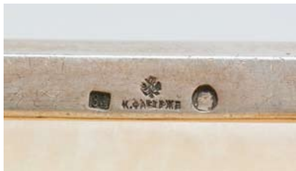
62 Лоток для драгоценностей в классическом стиле Россия, Москва, 1908–1917 гг. Фирма Карла Фаберже Серебро, литье, бовенит, монтировка

Клейма: 84-й пробы с женской головкой в кокошнике, повернутой вправо, в круглом щитке с шифром пробирного округа, фирмы – «К. Фаберже» под государственным гербом. Инвентарный номер – «28427». Длина 25 см. Общий вес 753,0 г