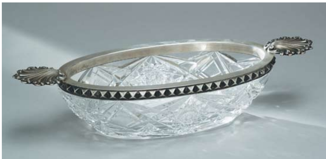
100 Конфетница Россия, Москва, 1908–1917 гг. Пятнадцатая Московская артель Серебро, литье, хрусталь, монтировка

Клейма: 84-й пробы, женской головки в кокошнике, повернутой вправо, в круглом щитке, мастерской – «15А». Длина 29,5 см. Общий вес 781,2 г