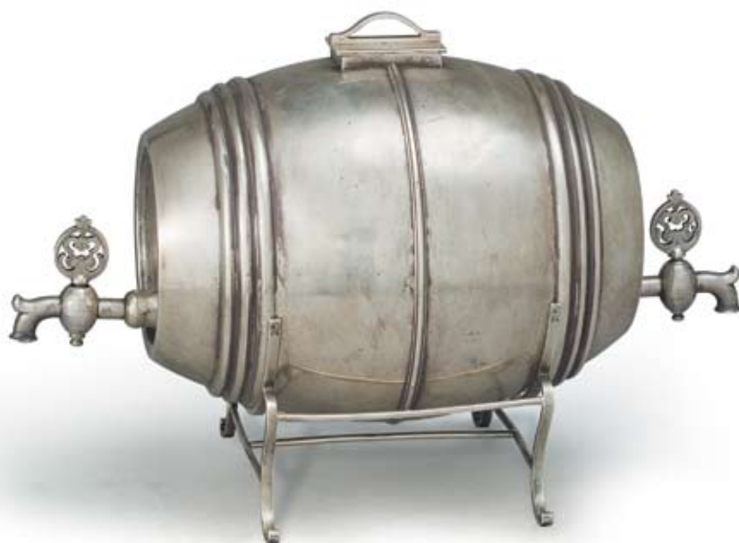
119 Сосуд для напитков в виде бочонка Россия, Москва, 1899–1908 гг. Фирма Ивана Хлебникова Серебро, литье, гравировка, монтировка

Клейма: 84-й пробы с женской головкой в кокошнике, повернутой влево, и инициалами пробирного мастера, фирмы – «ИХ». Высота 19 см. Общий вес 989,0 г