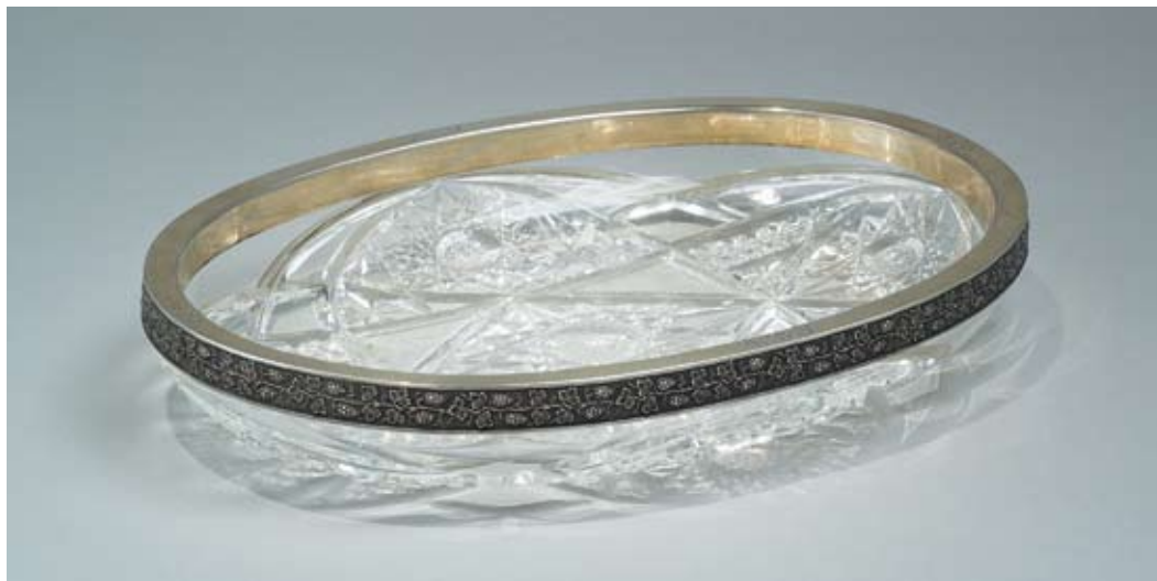
99 Конфетница Россия, Санкт-Петербург, 1908–1917 гг. Мастерская В. Гордона Серебро, хрусталь, монтировка

Клейма: 84-й пробы с женской головкой в кокошнике, повернутой вправо, в круглом щитке, мастерской – «В. Гордонъ». Сверху на ободке гравированные вензель и дата. Длина 30 см. Общий вес 1 909,2 г