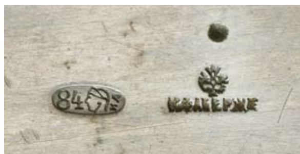
14 bis Братина «Чертополохи» Россия, Москва, 1899–1908 гг. Фирма Карла Фаберже Серебро, литье

Клейма: 84-й пробы с женской головкой в кокошнике, повернутой влево, и инициалами пробирного мастера, фирмы – «К. Фаберже» под государственным гербом. Инвентарный номер (плохо читаемый) – «17007». Диаметр 12 см. Вес 191,0 г