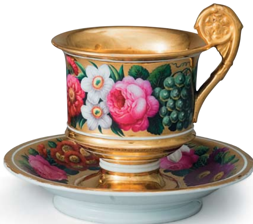
51 Чашка с блюдцем с цветочно-фруктовым декором Россия, Санкт-Петербург, первая треть XIX в. Императорский фарфоровый завод Фарфор, разделка золотом, живопись

Марка «Н I» под императорской короной, синяя, надглазурная.