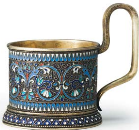
128 Подстаканник Россия, Москва, 1889 г. Фабрика золотых и серебряных изделий Густава Клингерта Серебро, перегородчатая эмаль, золочение

Клейма: 84-й пробы, герба города, пробирного мастера – «АА» над датой «1889», мастерской – «ГК». Высота 9,5 см. Вес 175,5 г