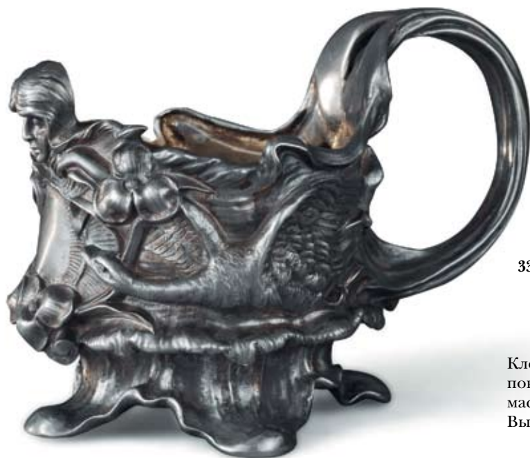
33 Подстаканник «Гуси-лебеди» Россия, Санкт-Петербург, 1899–1908 гг. Фирма «Братья Грачевы» Серебро, литье

Клейма: 84-й пробы с женской головкой в кокошнике, повернутой влево, и инициалами пробирного мастера, мастерской – «Бр. Грачевы» под государственным гербом. Высота 9 см. Вес 349,4 г