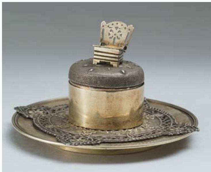
75 Солонка «Хлеб-соль» Россия, Москва, 1884 г. Мастер – монограммист «ЛФ» Серебро, чеканка, гравировка, позолота, монтировка

Клейма: 84-й пробы, герба города, пробирного мастера – «ВП» над датой «1884», мастерской – «ЛФ». Высота 6 см. Вес 121,7 г