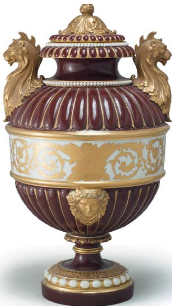
120 Ваза декоративная Россия, Санкт-Петербург, 1881–1894 гг. Императорский фарфоровый завод, период правления Александра III Фарфор, разделка красками, разделка золотом, монтировка

Марки «АШ» под императорской короной, зеленая, подглазурная, «А.Т» в тесте. Высота 48 см