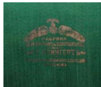
93 Набор столового серебра на 12 персон в оригинальном футляре Россия, Москва, 1908–1917 гг. Фабрика золотых и серебряных изделий Густава Клингерта Серебро, литье