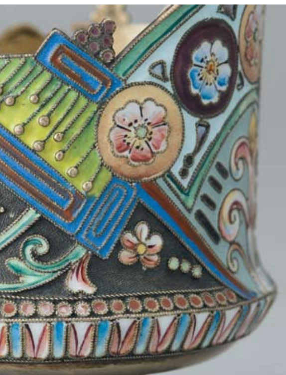
83 Чашка с блюдцем и ложкой Россия, Москва, 1908–1917 гг. Одиннадцатая Московская артель Серебро, перегородчатая эмаль, расписная эмаль

Клейма: 84-й пробы с женской головкой в кокошнике, повернутой вправо, и шифром пробирного округа, мастерской – «11А». Диаметр блюда 12,5 см. Общий вес 235,7 г