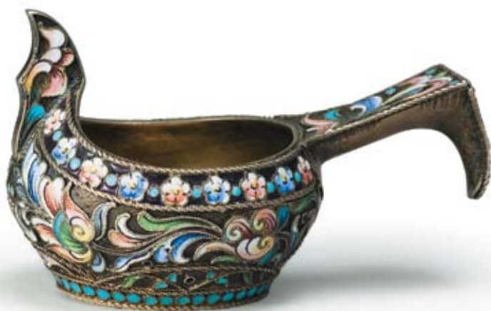
131 Ковшик Россия, Москва, 1908–1917 гг. Мастерская серебряных изделий Николая Зверева Серебро, перегородчатая эмаль, расписная эмаль

Клейма: 84-й пробы с женской головкой в кокошнике, повернутой вправо, в щитке в виде лопатки и шифром пробирного округа, мастерской – «НЗ».