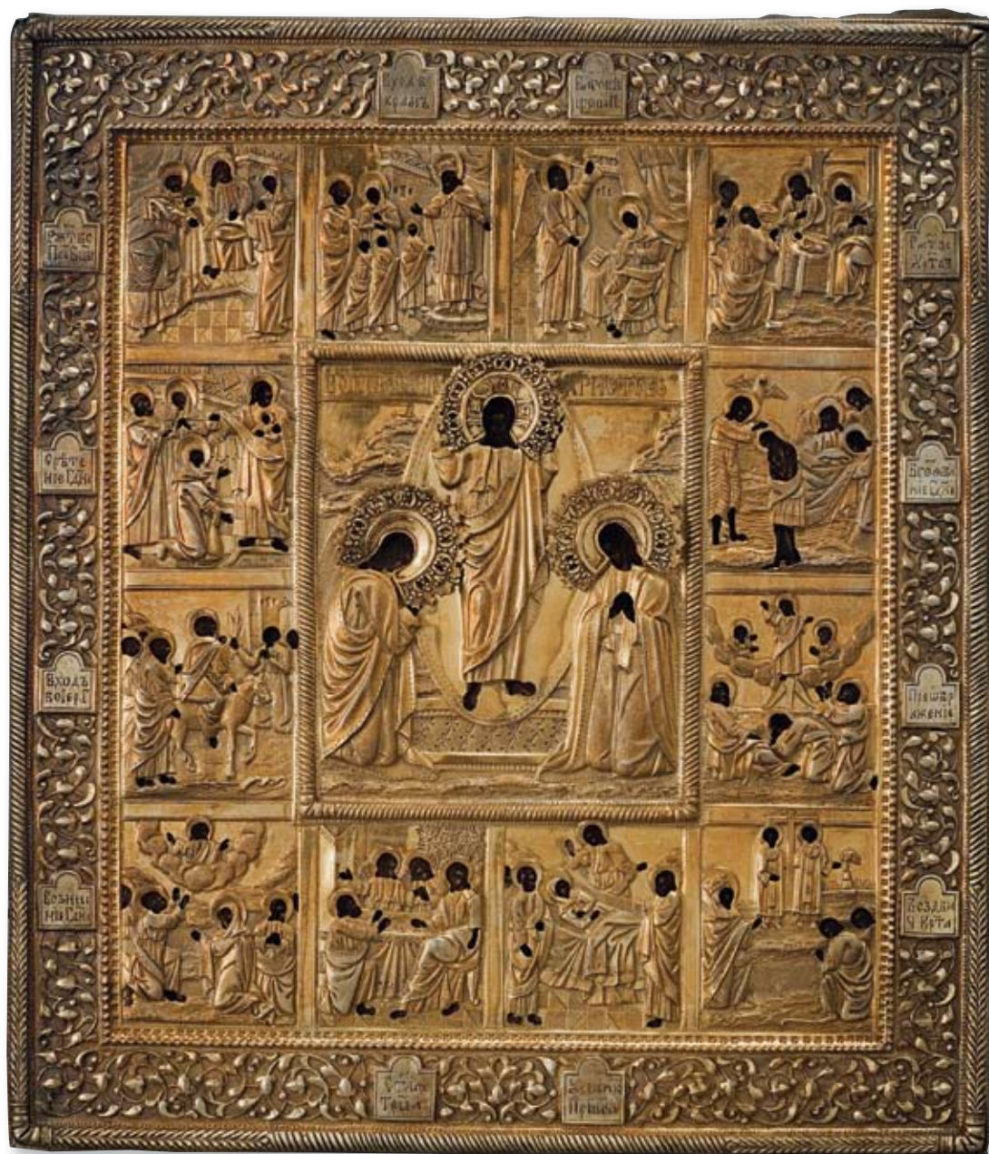
43 Икона «Праздники» Россия, Москва, 1873 г. Фабрика золотых и серебряных изделий Дмитрия Орлова Оклад: серебро, литье, прочеканка, монтировка, золочение

Клейма: 84-й пробы, герба города, пробирного мастера – «АС» над датой «1873», мастерской – «Д.О». Размер 26 x 31 см