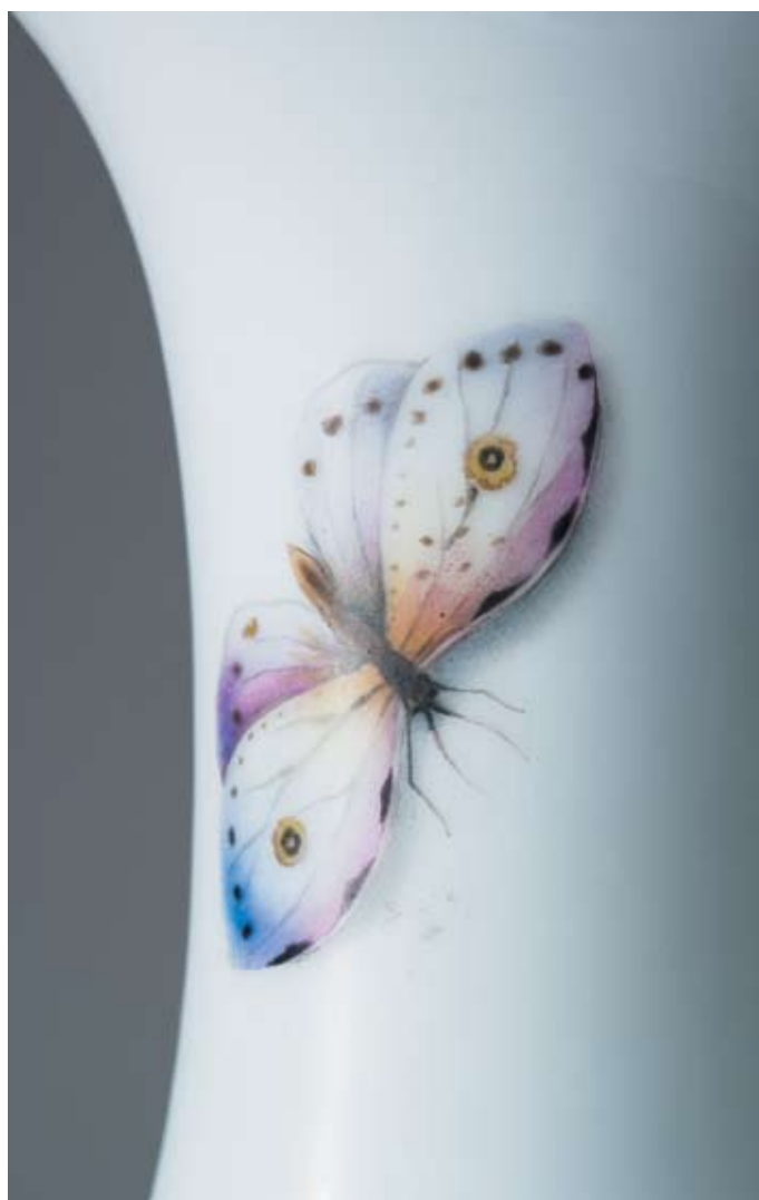
122 bis Вазы парные «Бабочки» Россия, Санкт-Петербург, 1855–1881 гг. Императорский фарфоровый завод, период правления Александра II Фарфор, живопись, разделка золотом

Марка «А II» под императорской короной и дата «1914», зеленые, подглазурные. Высота 23,5 см