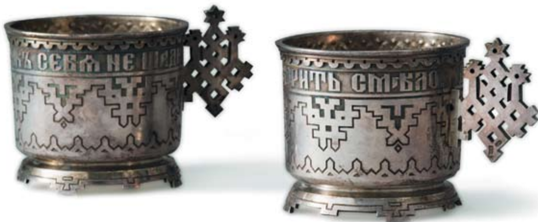
6 Подстаканники парные в русском стиле Россия, Санкт-Петербург, последняя четверть XIX в. Мастерская Игнатия Сазикова Серебро, резьба, гравировка

Клейма: 84-й пробы с гербом города, мастерской – «ИС». По кругу гравированные надписи: «Доброе дело, правду говорить смело» и «Дружбу водить, так себя не щадить». Высота 7 см. Общий вес 415,8 г