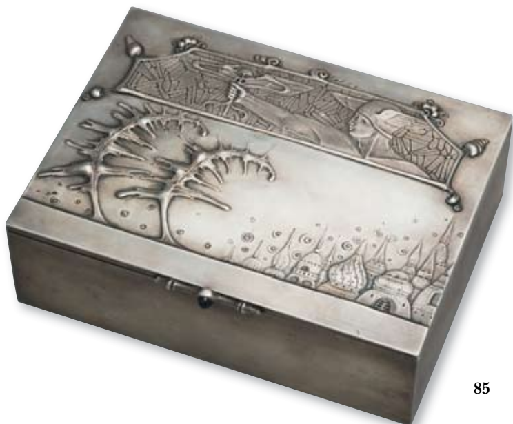
85 Коробка сигарная «Меркурий» Россия, Москва, 1908–1917 гг. Мастерская Петра Лоскутова Серебро, литье, кабошон, монтировка

Клейма: 84-й пробы с женской головкой в кокошнике, повернутой вправо, и шифром пробирного округа, мастерской – «П.Л».