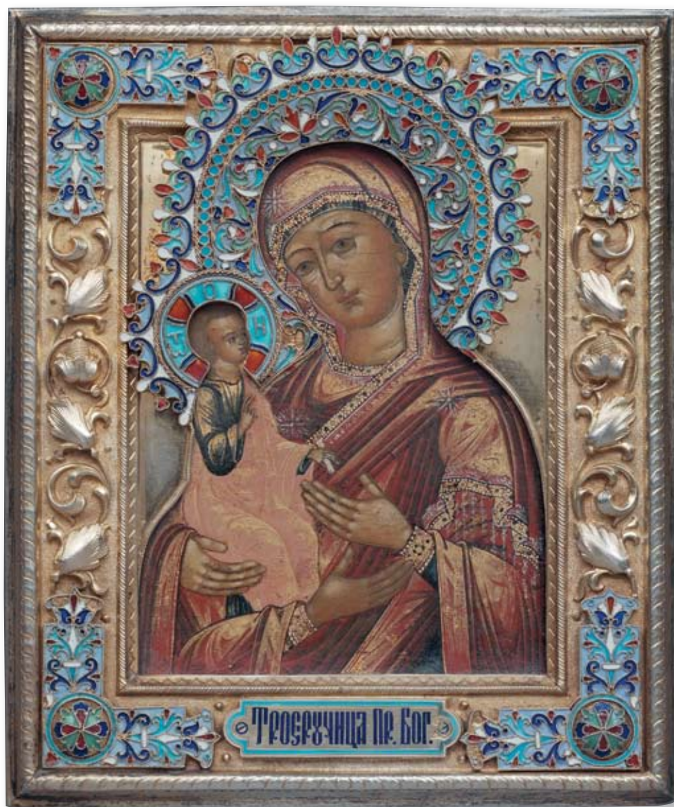
41 Икона «Троеручица Пресвятая Богородица» Россия, Москва, 1908–1917 гг. Мастер – монограммист «СКЗ» Оклад: серебро, перегородчатая эмаль, выемчатая эмаль, прочеканка, золочение

Клейма: 84-й пробы с женской головкой в кокошнике, повернутой вправо, и шифром пробирного округа, мастера – «СКЗ».