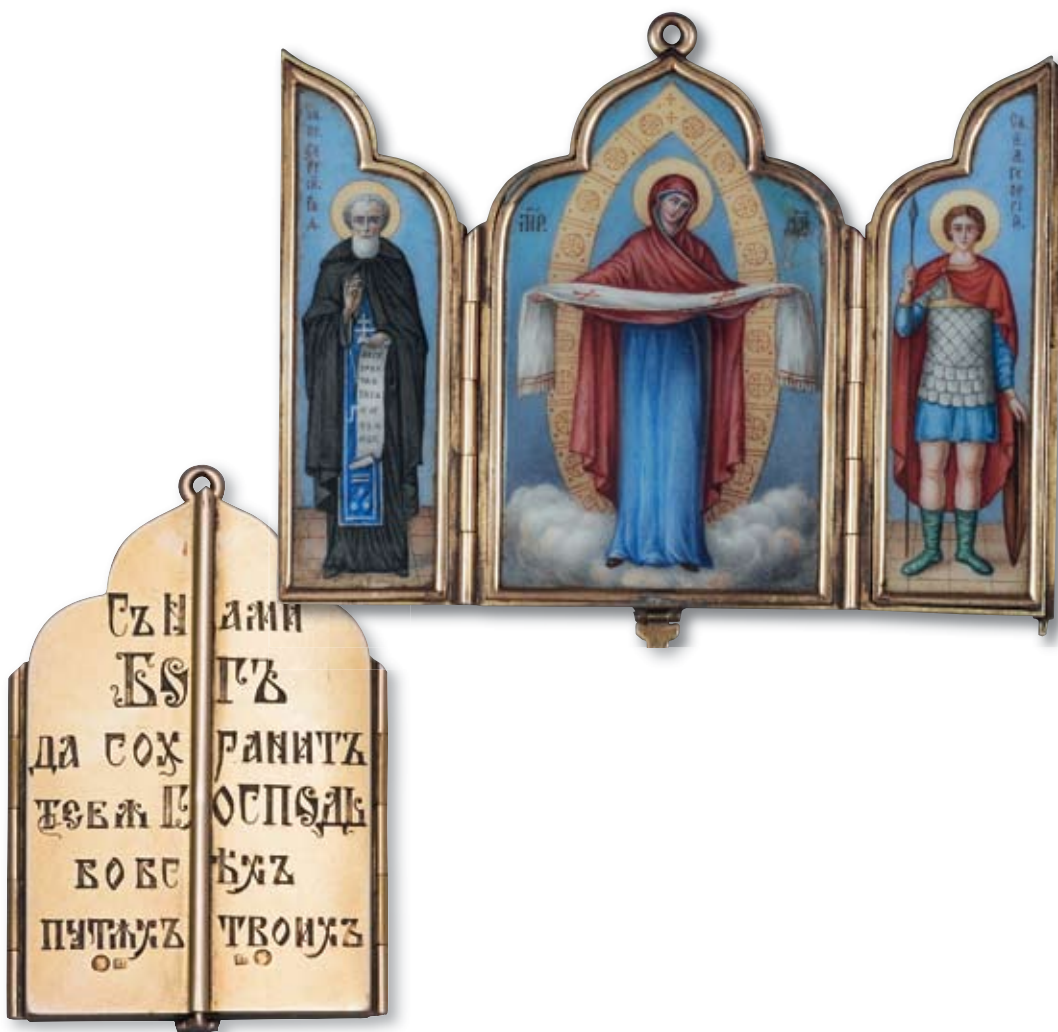
30 Складень «Матерь Божия с предстоящими: Святым Георгием и Святым Сергием Радонежским» Россия, Москва, 1908–1917 гг. Мастер – монограммист «ПГ» Золото, гравировка, монтировка, живописная эмаль