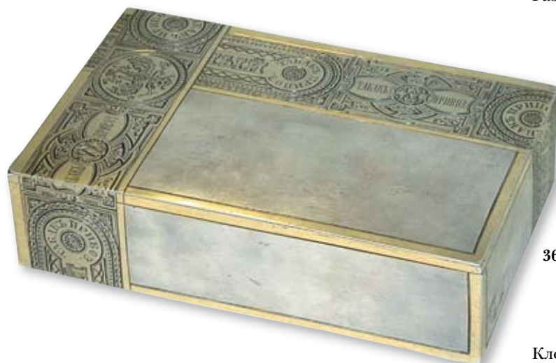
36 Коробка сигарная Россия, Санкт-Петербург, 1894 г. Мастер – монограммист «SW» Серебро, гравировка, золочение, монтировка

Клейма: 84-й пробы с гербом города, инициалами пробирного мастера и датой «1894», мастерской – «S.W».