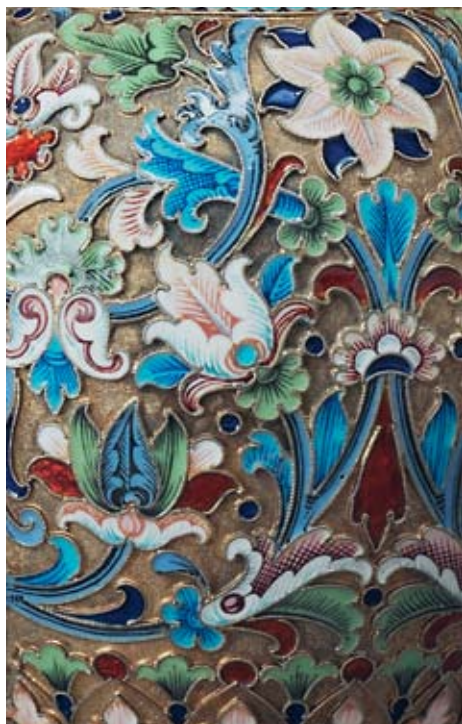
47 Чайный набор: чайник, сахарница, сливочник Россия, Москва, 1899–1908 гг. Мастерская Ивана Салтыкова Серебро, перегородчатая эмаль, расписная эмаль

Клейма: 84-й пробы с женской головкой в кокошнике, повернутой влево, и инициалами пробирного мастера, мастерской – «И.С». Высота чайника 10,5 см. Общий вес 975,5 г. Незначительные повреждения эмали. Имеется современный подарочный футляр.