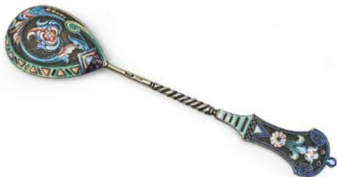
127 Ложка чайная Россия, Москва, 1908–1917 гг. Одиннадцатая Московская артель Серебро, перегородчатая эмаль, расписная эмаль

Клейма: 88-й пробы с женской головкой в кокошнике, повернутой вправо, в щитке в виде лопатки и шифром пробирного округа, мастерской – «11.А». Длина 14,5 см. Вес 24,6 г