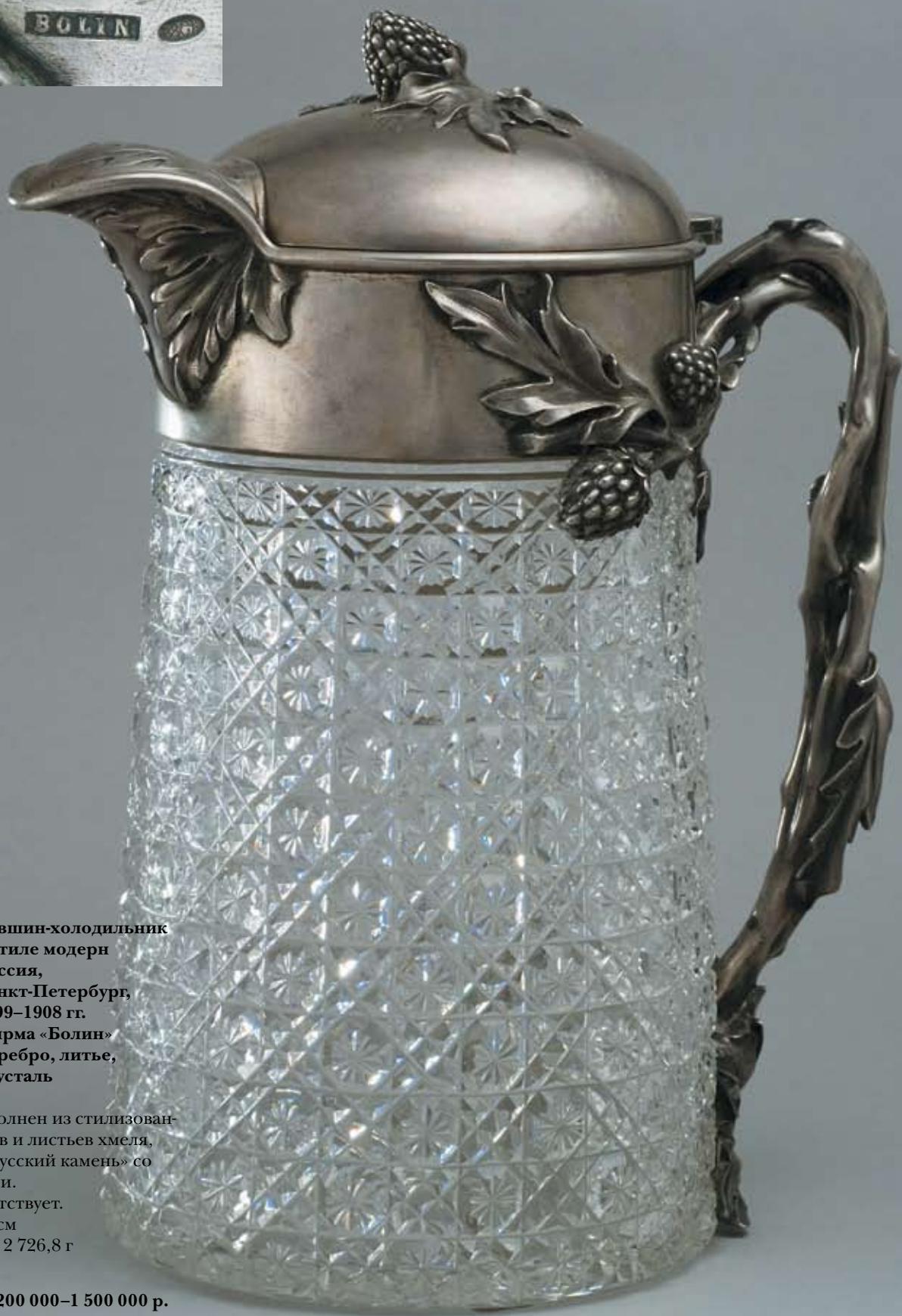
5 Кувшин-холодильник в стиле модерн Россия, Санкт-Петербург, 1899–1908 гг. Фирма «Болин» Серебро, литье, хрусталь

Декор выполнен из стилизованных плодов и листьев хмеля, стекло – «русский камень» со звездочками.