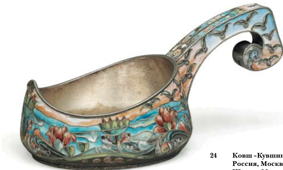
24 Ковш «Кувшинки» Россия, Москва, 1908–1917 гг. Шестая Московская артель Серебро, перегородчатая эмаль, расписная эмаль

Клейма: 84-й пробы с женской головкой в кокошнике, повернутой вправо, и шифром пробирного округа, мастерской – «6МА». Длина ковша 12 см. Вес 97.4 г