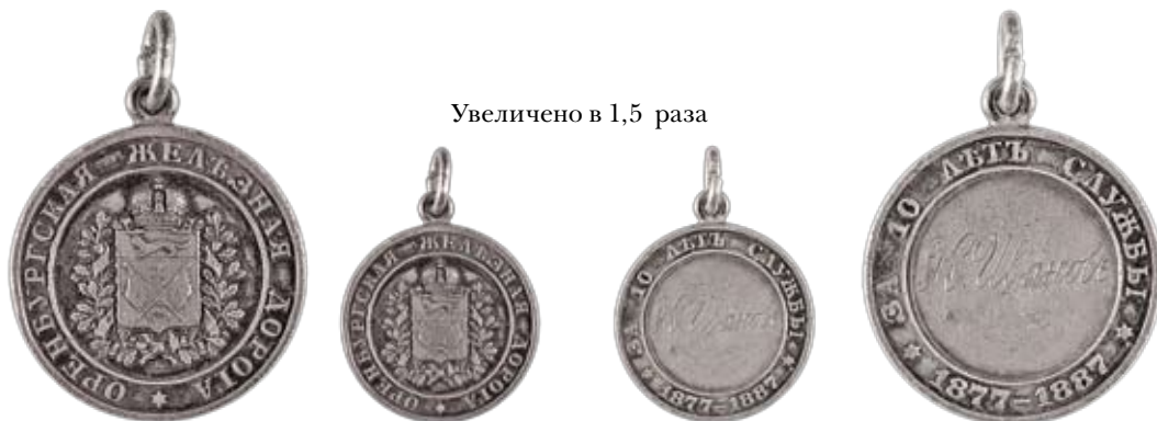
Увеличено в 1,5 раза