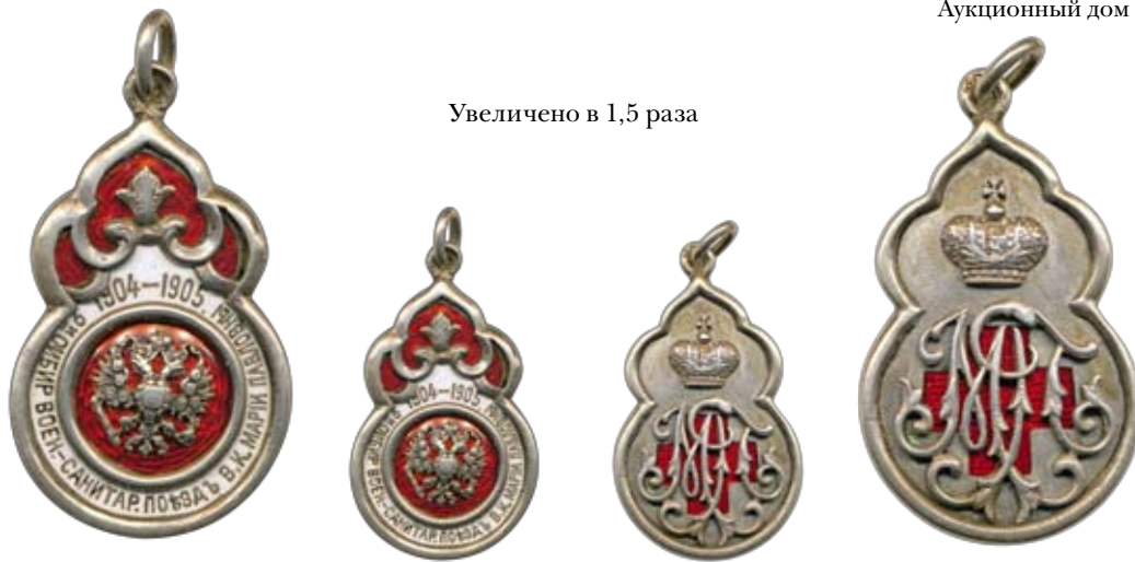
Увеличено в 1,5 раза