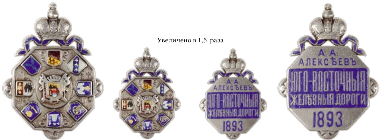
Увеличено в 1,5 раза