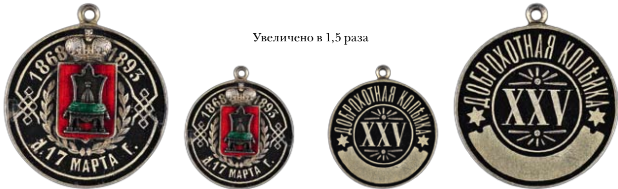
Увеличено в 1,5 раза