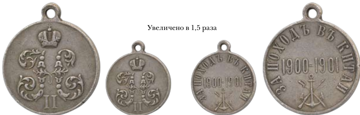
Увеличено в 1,5 раза