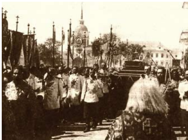
Крестный ход с мощами преподобного Серафима Саровского 17 июля 1903 г.