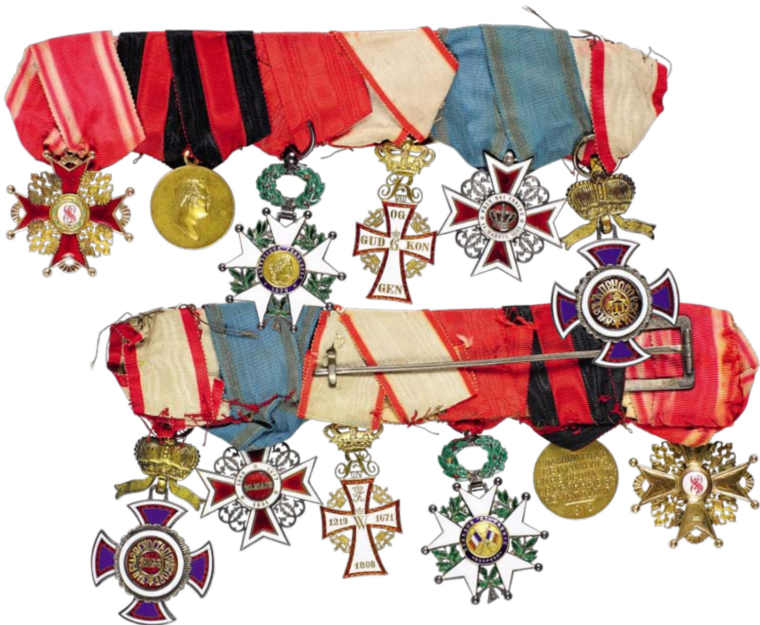
142. 1–6 Орденская колодка на шесть награждений барона Алексея Юльевича Иксуль фон Гильденбандта с комплектом наградных документов 142. 1. Орденская колодка на шесть награждений Общий вес 140.92 г