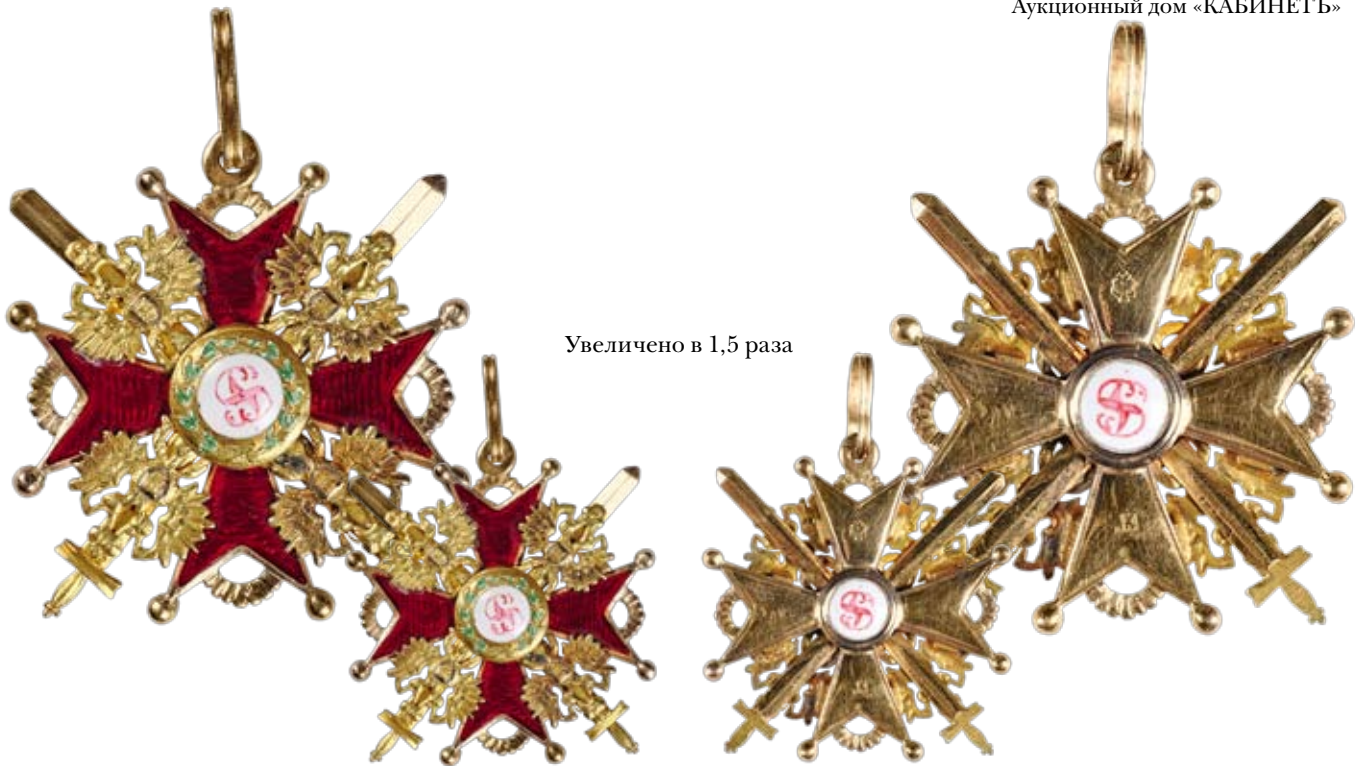
Увеличено в 1,5 раза