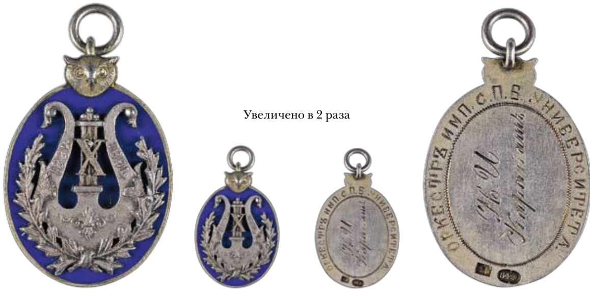
Увеличено в 2 раза