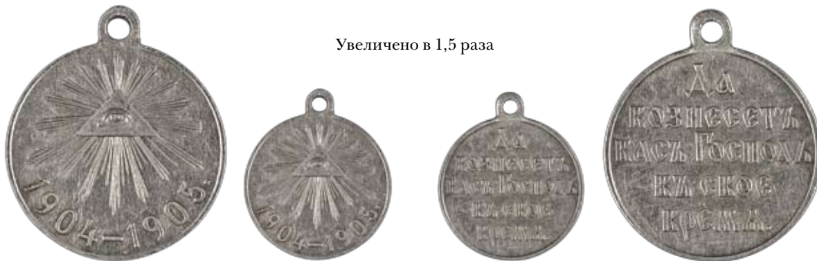
Увеличено в 1,5 раза