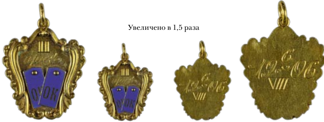
Увеличено в 1,5 раза