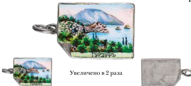
Увеличено в 2 раза