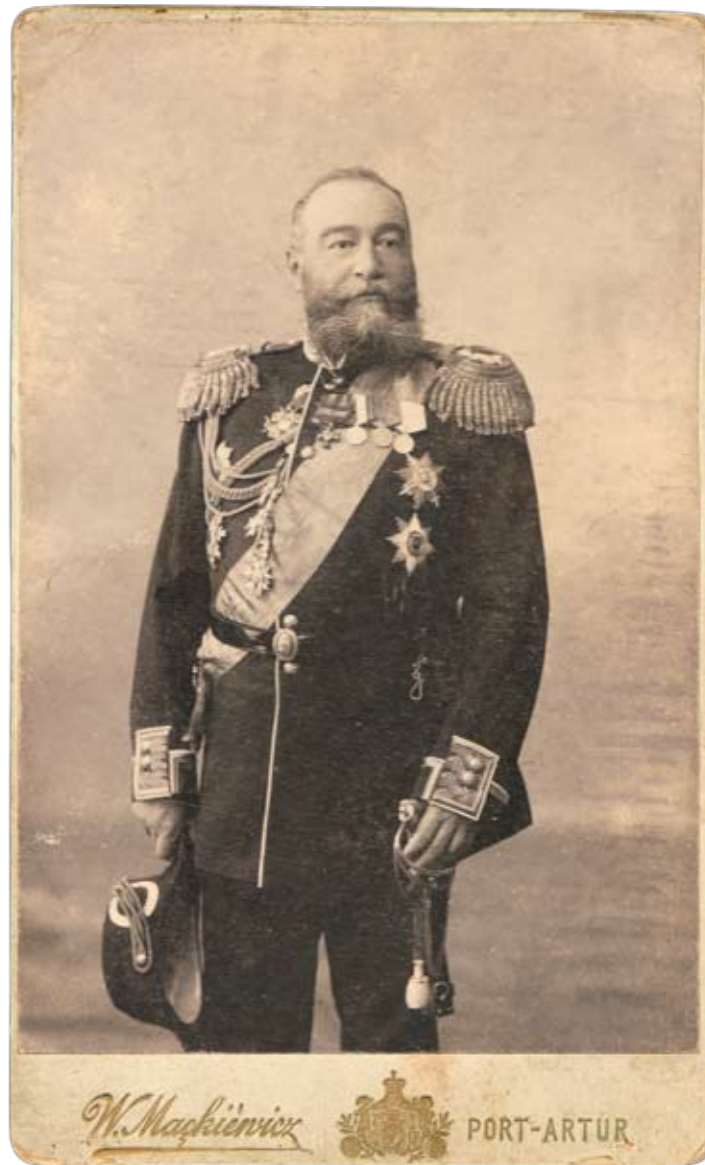
105 Фотография генерал-адмирала, наместника Его Императорского Величества на Дальнем Востоке Евгения Ивановича Алексеева Порт-Артур, фотоателье В. Мацкевича. 1904 г. Фотография 188 x 124мм; паспарту 211 x 129 мм.

Алексеев Евгений Иванович (1843–1917) – российский военный и государственный деятель, генерал-адъютант (1901), адмирал (1903). Член Государственного совета (1905).