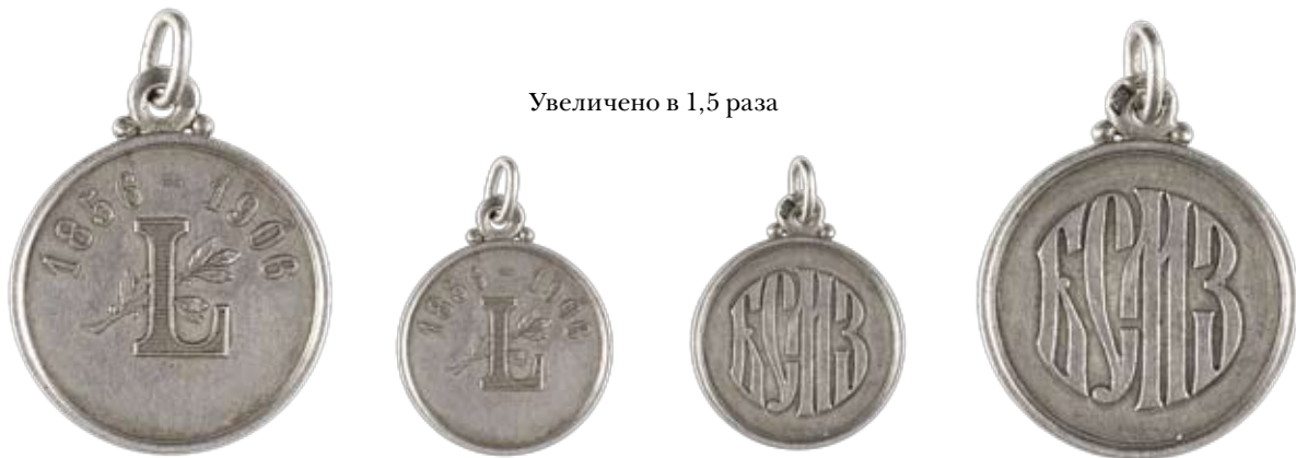
Увеличено в 1,5 раза